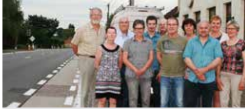
Heraanleg Brugse Baan komt eraan p. 2