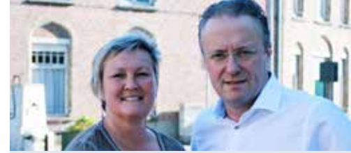
Wim wikt p. 3