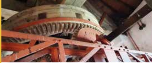
Restauratie Merelaanmolen gestart (p.2)