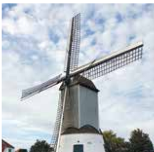
▲ We mikken op een succesvolle toeristische invulling na de restauratie, zoals dat ook gebeurde bij de Oostmolen.

Het project wordt opgedeeld in verschillende fasen, om zo optimaal te voldoen aan de subsidievoorwaarden. Zo kunnen we in een periode van vijf jaar twee keer een subsidie van 250.000 euro krijgen. We verwachten dat de laatste fasen van de renovatie na 2030 zullen plaatsvinden (zie tijdlijn). Tenzij we via een projectoproep sneller kunnen werken en dus kosten kunnen uitsparen.”