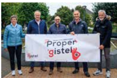
▲ Bestuursleden en mandatarissen van N-VA Gistel staan achter de slogan.