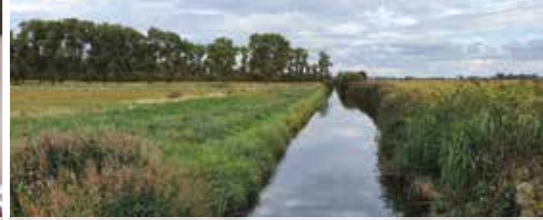
Gistel onderdeel van Regionaal Landschap