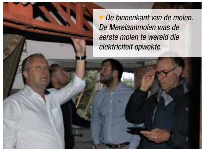
▼ De binnenkant van de molen. De Merelaanmolen was de eerste molen te wereld die elektriciteit opwekte.